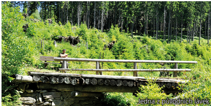
Jedna z původních lávek

Správa KRNAP v posledních letech investovala do oprav desítek kilometrů cest a turistických chodníků stovky milionů korun. Součástí prací jsou i rekonstrukce dřevěných lávek přes potoky. red